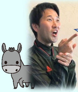
のぶちかさんの かんが 考え

100円均一ショップで買うものが非常に多いです。 お店が混んでくる前に、たくさん買うものがあるところに先に行った ほうがいいのではないのでしょうか？ 車も100円均一ショップの近くの EやFあたりに止められるとよいのでは？