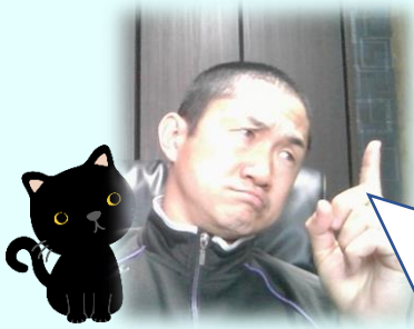
しゅうたろうさんの かんが 考え

そういう考え方もできるけど、お店が混み合うところでは スーパーのほうがお昼に向けて混んでくるから、先にスーパーに 行ったほうがよいだろう？ 車を止めるところは当然、真ん中のDだ！