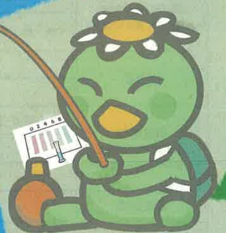
水質パトロール隊キャラクター かっぱとくん